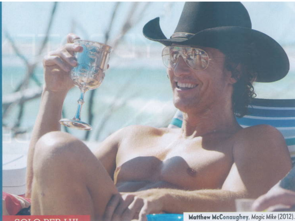
Matthew McConaughey, Magic Mike (2012).

In basso, in senso orario. Promette risultati in due settimane: Trattamento Pancia e Addome Intensivo Notte di Somatoline Cosmetic . Nella formula ci sono peperoncino e tè verde per stimolare e snellire: Gel Addominali Scolpiti di BioEtyc Uomo . Riduce gli accumuli adiposi e potenzia l'effetto dello sport: Abdo Lift di Vichy Homme . Rassodante, ideale prima e dopo l'allenamento: Culturist di Jeanne Piaubert . Con complesso di fitoestratti liporiducanti: Trattamento Addominali Perfetti di Collistar Linea Uomo . E chi fa shopping da Sephora entro il 30 settembre può vincere un viaggio in Florida con tanto di spettacolo di striptease maschile. Per informazioni: www.magicmikefilm.it/sephora