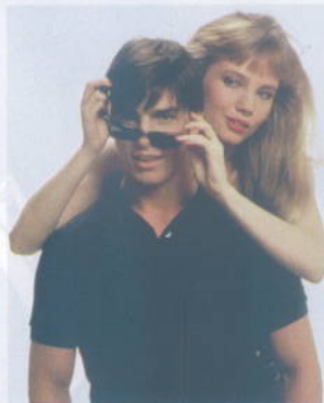
Tom Cruise, Risky Business (1983).