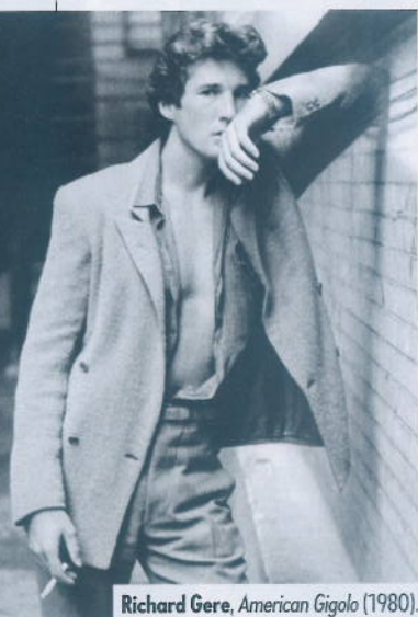
Richard Gere, American Gigolo (1980).

Ogni tanto capita che i ruoli si ribaltino e a doverci mostrare mezzi nudi e sexy per forza siano gli uomini. Succede grazie all'arrivo nei cinema di Magic Mike , il film di Steven Soderbergh con Matthew McConaughey e Channing Tatum, spogliarellista navigato che insegna i segreti del mestiere alla matricola Alex Pettyfer. Trama a parte, il film è anche l'occasione per godersi un tripudio di muscoli. Perché, a differenza degli uomini-oggetto delle pellicole del passato, da Richard Gere di American Gigolo , più magnetico che fisico, al fascino acerbo di Ryan Phillippe in Studio 54 , adesso ai sex symbol è richiesto un corpo atletico. Così, il magico Mike è l'espressione dello sportivo moderno: un marcantonio statuario con muscoli definiti, gonfi quanto basta. Un po' come quelli del protagonista della serie tivù Hung - Ragazzo squillo , ex campione di basket che diventa un escort. Chi sogna una platea di donne urlanti è avvisato: non basta saperci fare, servono proteine, palestra e creme rassodanti. VF