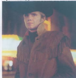
Jon Voight, Un uomo da marciapiede (1969).