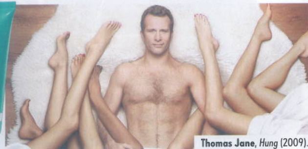
Thomas Jane, Hung (2009).