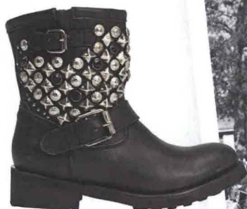
HARD DÉCOR Con borchie e pietre, Ash (€ 350).