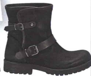
EFFETTO USED Di pelle invecchiata, Bagatt (€ 125).