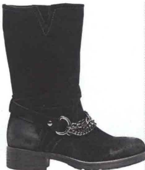
PUNK Con le catene, Alesya by Scarpe & Scarpe (€ 69,90).