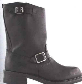
CLASSICO Doppia fibbia, Walker (€ 249).