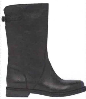
MINIMAL Con fibbia-targhetta, Dolce & Gabbana (€ 653).