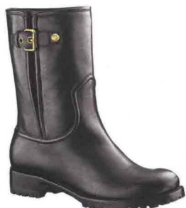
CARRARMATO Con inserto plissé sul lato, Louis Vuitton (€ 1.000).