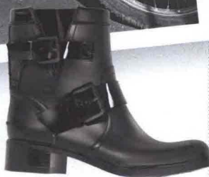
DI GOMMA Disegnato da Diego Dolcini, Pirelli PZero (€ 180).