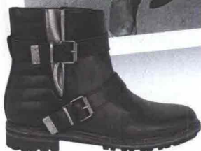
IMPUNTURE Basso, con dettagli metal, Zadig & Voltaire.