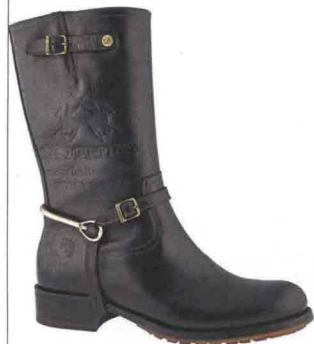
CON LA STAFFA Logo impresso a fuoco, La Martina Shoes (€ 349).