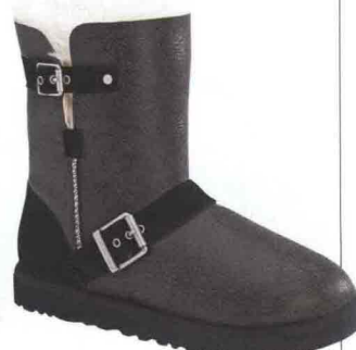
ANTI-FREDDO Di montone, UGG Australia (€ 273).