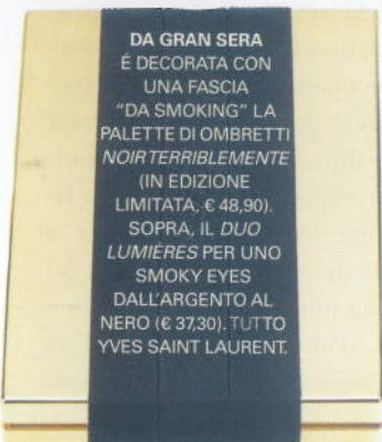
DA GRAN SERA È DECORATA CON UNA FASCIA "DA SMOKING" LA PALETTE DI OMBRETTI NOIR TERRIBLEMENTE (IN EDIZIONE LIMITATA, € 48,90). SOPRA, IL DUO LUMIÈRES PER UNO SMOKY EYES DALL'ARGENTO AL NERO (€ 37,30). TUTTO YVES SAINT LAURENT.