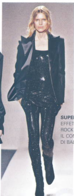
SUPER SHINE EFFETTO ROCK PER IL COMPLETO DI BALMAIN.

SGUARDO "STELLARE" PER UNA SERATA SPECIALE, LE CIGLIA FINTE CON TANTO DI VIA LATTEA, MINI STAR GLITZ DI SHU UEMURA (€ 26).