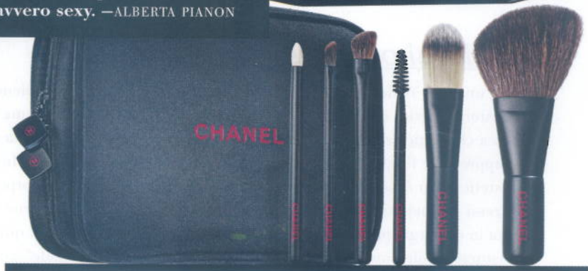
PROFESSIONALI SEI PENNELLI AD ALTA PRECISIONE E UNA TROUSSE DI RASO PER CONTENERLI TUTTI (MA C'È SPAZIO ANCHE PER BLUSH E ROSSETTI): LE MINIS DE CHANEL È L'ACCESSORIO INDISPENSABILE PER CHI DESIDERA UN MAKE-UP SEMPRE PERFETTO (€ 80).