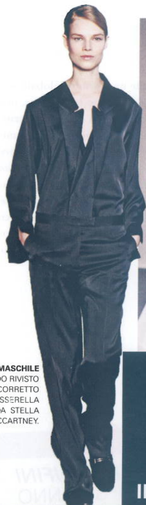
MASCHILE TUXEDO RIVISTO E CORRETTO IN PASSERELLA DA STELLA MCCARTNEY.